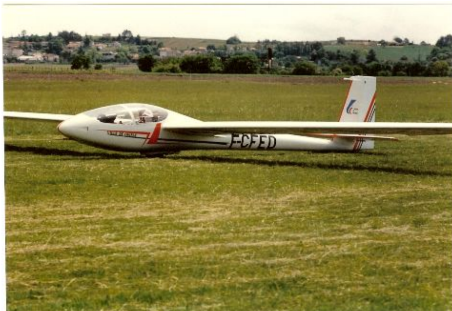
Dernière photo du Silène à Cognac -Vendu en Juin 1986

Suite aux différentes aides et à l'arrivée du Marianne qui paraissait très prometteur, Cognac à mis en vente Echo Delta pour acquérir le Marianne N°11 F-CGMK. C'est un privé qui a acheté l'appareil, le laissant basé quelques temps à Cognac, son acquéreur et toute sa famille utilisaient le Silène, ce qui leur valut le nom de « famille Delta ».