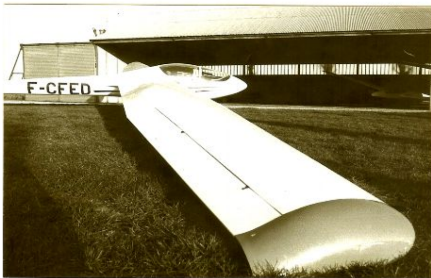
Silène ECHO DELTA Cognac Février 1984